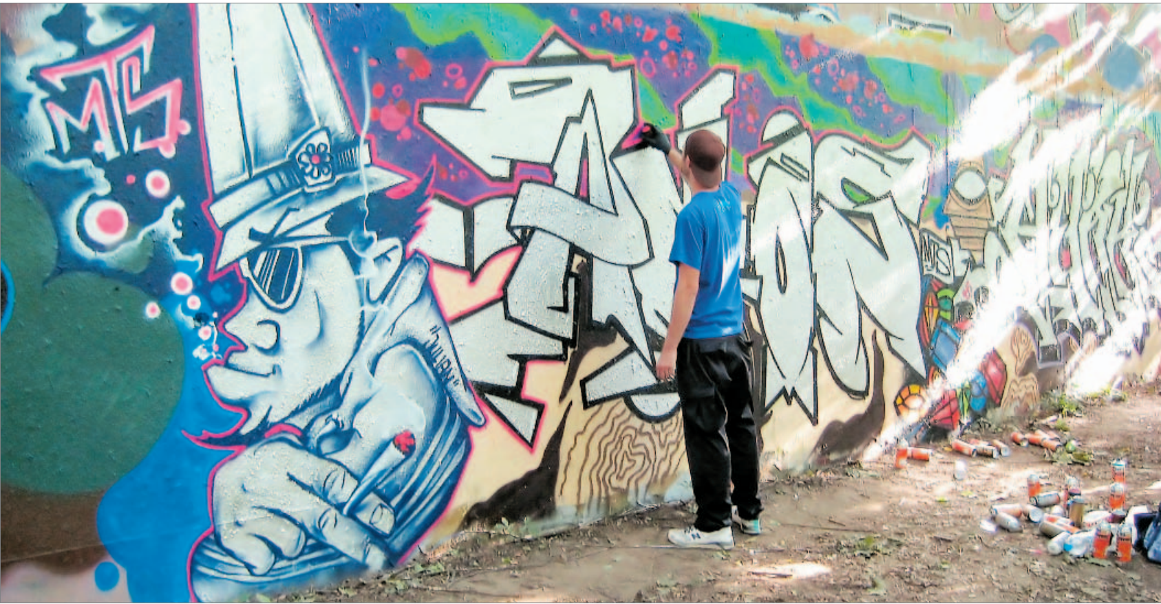
Typisches Graffiti: Cartoon-Bilder und riesige Buchstaben. Deren Sinn ist für den Außenstehenden schwer zu ermitteln, meist sind es Abkürzungen.